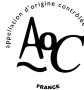
Appellation d'Origine Contrôlée