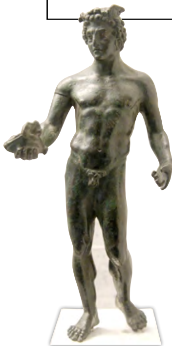
Statuette de Mercure - Musée du Louvre (n° d'inventaire Br 51)

Comment pourrait-on expliquer l'existence d'une série de statuettes presque identiques ?