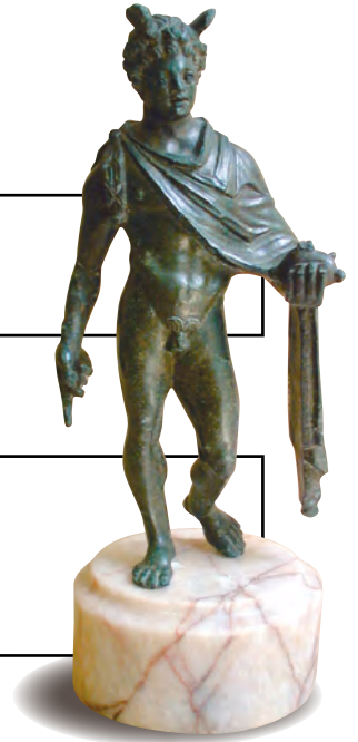
Statuette en bronze à patine noire Découverte au sommet du puy de Dôme en 1906 H. 17,5 cm Musée Bargoin, Clermont-Ferrand Fac-similé présenté à l'Espace temple de Mercure

Décrire la statuette (posture, âge, allure générale, visage, chevelure, vêtements...)