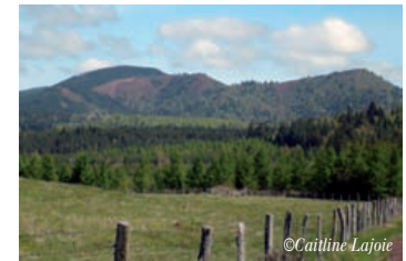
La Chaîne des Puy