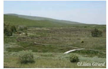
Tourbière du Cézallier