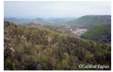
Pays des Couzes