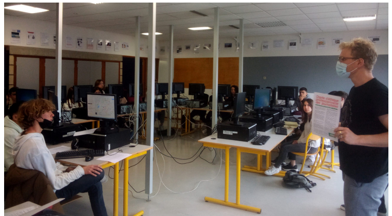
Interventions projet podcast et Semaine de la Presse et des Médias à l'école