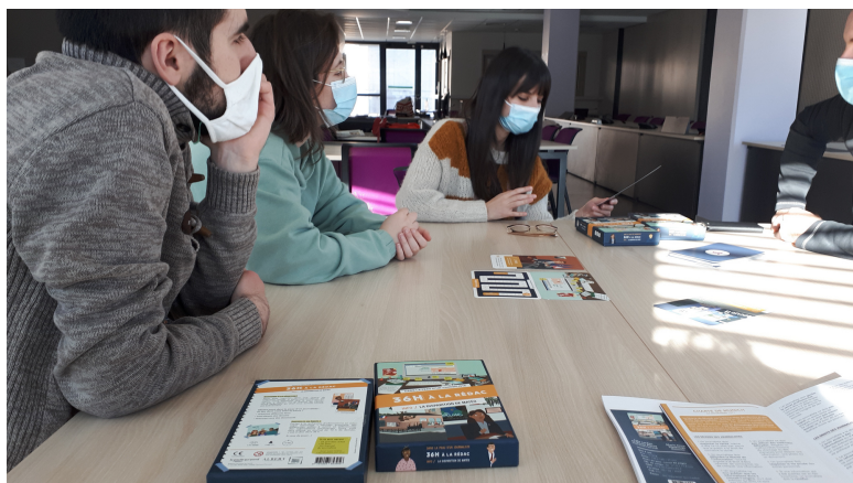
Formation professionnelle de 2 jours pour Médiat (Voiron, 2022)

Mais aussi : savoir évaluer ses actions EMI pour les faire évoluer et les pérenniser, utiliser les fonds spécifiques (archives, BD, son, vidéo, jeux...) pour monter des activités en EMI.