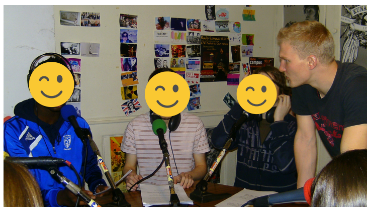
Projet radio en lycée technique (2009)

J'interviens régulièrement dans des séminaires professionnels ou des conférences grand-public.