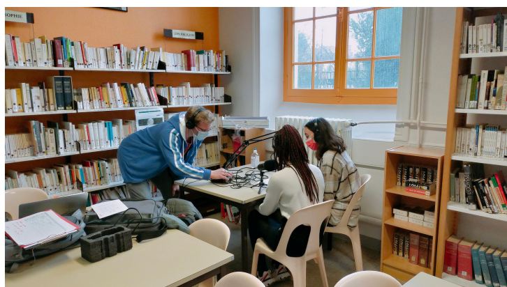
Projet podcast en lycée général (2022)