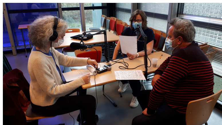
Formation professionnelle sur la création de podcast en médiathèques (2021)