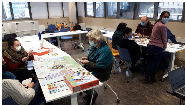
Formation professionnelle d'une journée pour Médiat (Lyon, 2022)