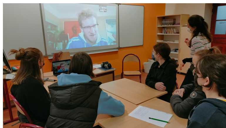
Atelier podcast en visioconférence (2022)