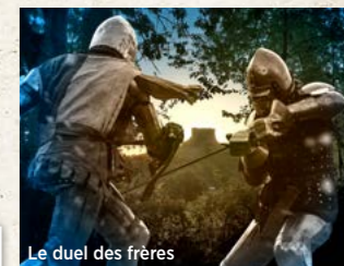
Le duel des frères