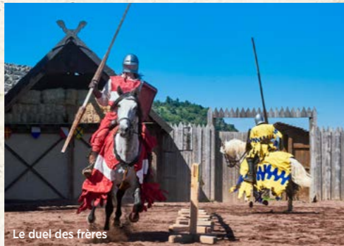
Le duel des frères