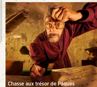
Chasse aux trésor de Pâques