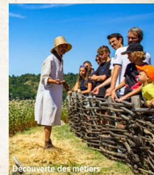
Découverte des métiers