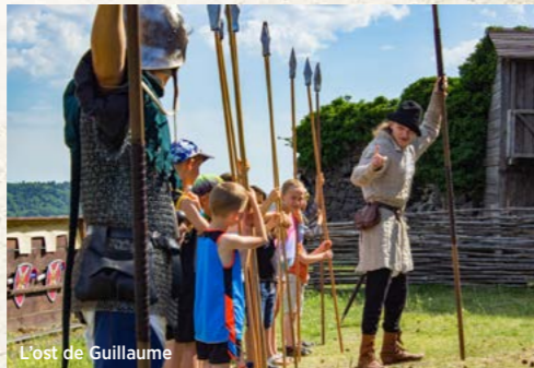
L'ost de Guillaume

Du vendredi 12 juillet au samedi 31 août, uniquement les vendredis et samedis À 10h30, 11h30, 14h30, 15h30, 16h30 et 17h30