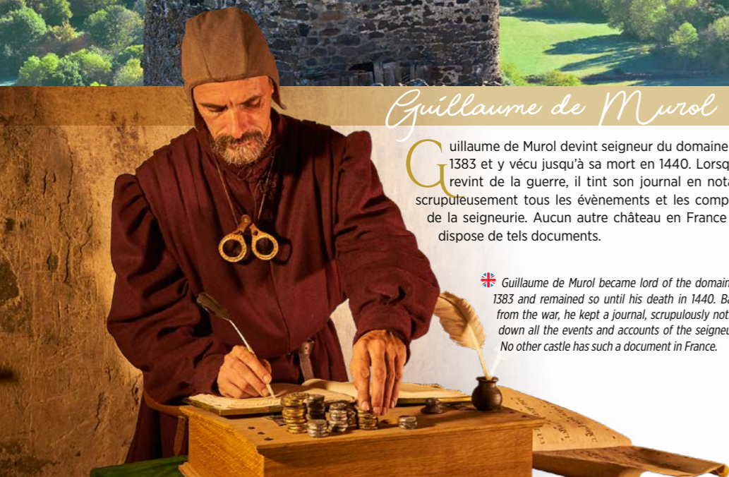
La garde-robe du seigneur