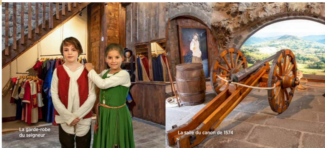
La salle du canon de 1574