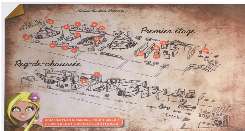
-Carte plastifiée du musée-