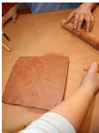
Photos prises par les médiatrices ; partie visite et partie pratique.