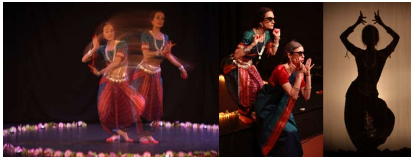
En haut, Les Envolées — en bas, Nartaki

jusqu'en 2015, Les Envolées , balade sensible et chorégraphique 2020-2021 et La Robe à histoires , création 2021-2022. Déjà plus de 30 dates envisagées pour 2023.