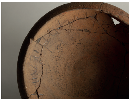
■ Jatte ornée d'une inscription votive, 1 er siècle ap. J.-C., Collection musée départemental de la Céramique.