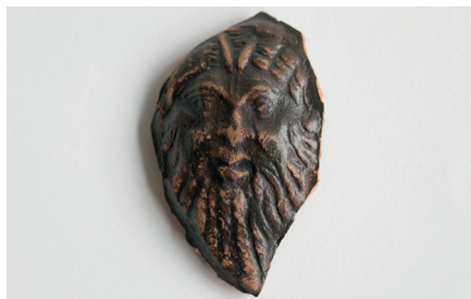
■ Relief d'applique : masque de Pan, II e ou III e siècle ap. J.-C., Collection musée départemental de la Céramique.

Pas étonnant qu'ils aient inspiré des générations d'artisans et de fabricants de vases à boire, de la Grèce archaïque et classique (VI e - IV e siècles av. J.-C.) jusqu'à la Gaule romaine (I er - V e siècles ap. J.-C.). Les satyres suivent Dionysos/Bacchus, dieu du vin et du banquet : là où ça trinque, ça chante, ça danse... et ça dérape, ils ne sont jamais loin.