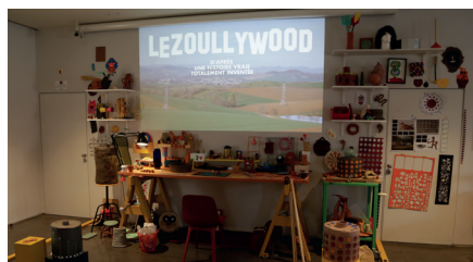
■ Mise en scène du bureau fictif de l'artiste (un period-room), semblant avoir été quitté la veille par son occupant.