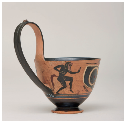
■ Kyathos : une ménade entre deux satyres, V e siècle av. J.-C. - I er siècle ap. J.-C., Collection BnF, département des Monnaies, médailles et antiques.

Grâce à des prêts exceptionnels de la BnF (vases, bronze, décors architecturaux) et aux collections du musée, l'exposition dresse le portrait savoureux de ces champions de l'excès : ludiques, débridés, parfois gênants, souvent drôles, et finalement terriblement humains.