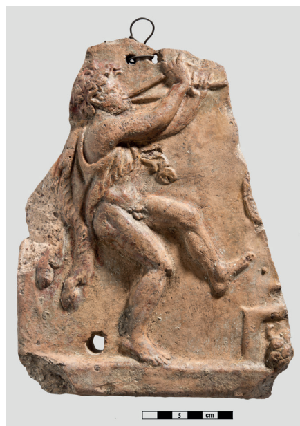
■ Relief architectural en terre cuite : jeune satyre, I er siècle av. J.-C. - I er siècle ap. J.-C., Collection BnF, département des Monnaies, médailles et antiques.

Tout public sans réservation, dans la limite des places disponibles. Entrée libre et gratuite.