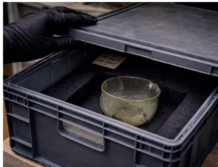
■ Réserves du musée départemental de la Céramique.

Conçues comme des petites fenêtres ouvertes sur les réserves, ces mini-expositions invitent à revenir au musée tout au long de l'année : à chaque visite, une nouvelle histoire à explorer.