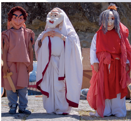
■ Atelier L'école de théâtre.

Certaines activités seront accessibles sur réservation, consultez le site internet du musée.