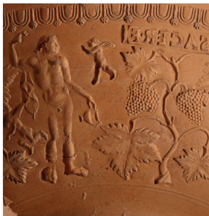
■ Décors en creux représentant Bacchus sur un fragment de moule. Époque gallo-romaine, collection du musée.

Pour connaître les modalités, suivez l'actualité du musée.