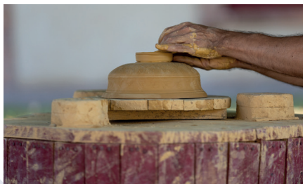
■ Démonstration de tournage d'une sigillée par Arnau Trullén.

Accompagnés du potier Arnau Trullén de l'atelier Ars Fictilis, vous découvrirez comment l'archéologie expérimentale permet de retrouver les gestes et les techniques de nos ancêtres.