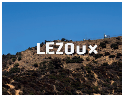
■ Photomontages de Simon Geneste.

Pour connaître l'intégralité du programme et les modalités de réservation, suivez l'actualité du musée.