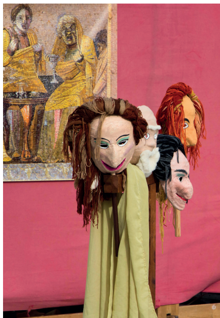
■ Reproduction de masques de théâtre romains.

Des animations et des spectacles rythmeront cette exposition ; pour connaître l'intégralité du programme, suivez l'actualité du musée.