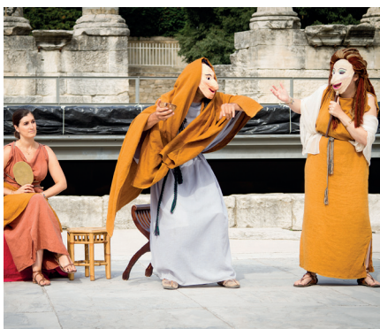
■ Les comédiens d'Acta